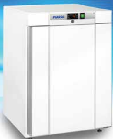
K 200 LUSO