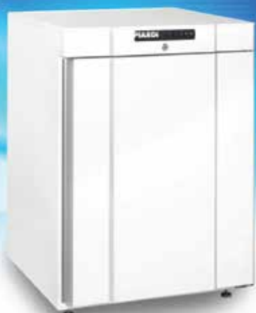
K 200 BASE