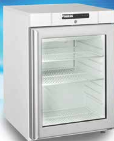
KG 200 BASE