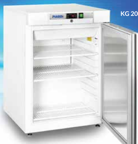
KG 200 LUSO